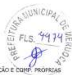
TABELA: SEINFRA 027.1 COM DESONERAÇÃO E COMP. PRÓPRIAS BDI: 25,44%

OBRA: URBANIZAÇÃO E REFORMA DE UMA PRAÇA NO DISTRITO DE FLORESTA, NO MUNICÍPIO DE MERLUÇA-CE LOCAL: DISTRITO DE FLORESTA, MERLUÇA/CE REF.: TOMADA DE PREÇOS Nº 0107.01/2022 RAZÃO SOCIAL: CLEZINALDO S. DE ALMEIDA CONSTRUÇÕES - ME CNPJ: 22.575.652/0001-97