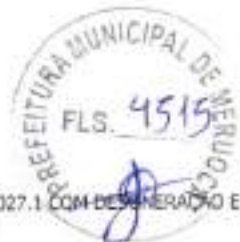
TABELA: SEINFRA 027.1 - COM DESEMPENHO E COMP. PRÓPRIAS BDI: 25,44%