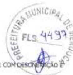
TABELA: SEINFRA 027.1 COM DESONERACÃO E COMP. PRÓPRIAS BDI: 25,44%