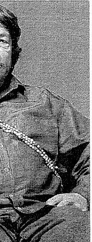
O escritor ocupará a cadeira nº 5, antes ocupada pelo historiador José Murilo de Carvalho

O escritor Ailton Krenak foi eleito, nessa quinta-feira (5), para a Academia Brasileira de Letras (ABL) e se tornará a primeira pessoa indígena a ocupar uma cadeira na instituição centenária. Ele era favorito desde que postulou a candidatura, em setembro, mas chegou a ser ameaçado na corrida pela historiadora Mary Del Priore e pelo também líder indígena Daniel Munduruku.