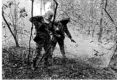
Estado já registra, somente neste mês, 147 focos de incêndios