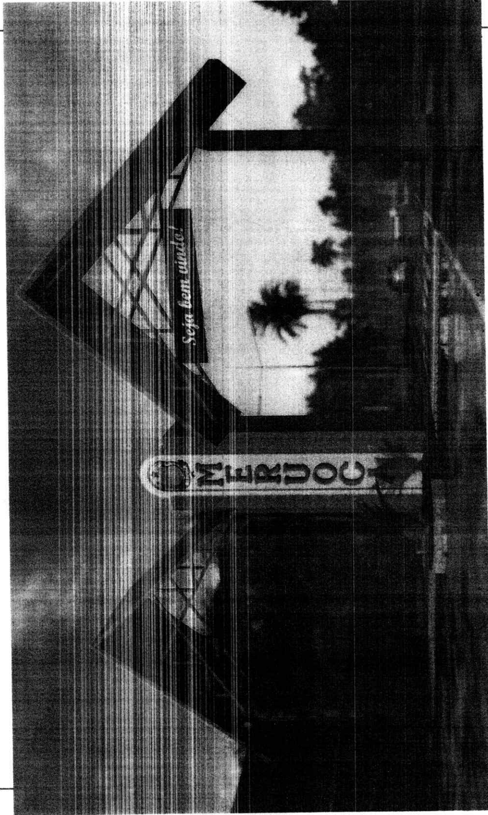
ILUSTRAÇÃO PÓRТИCO DE ENTRADA

Secretaria de Infraestrutura e Urbanismo