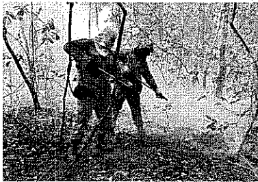
Estado já registra, somente neste mês, 147 focos de incêndios

TEMPO NO BRASIL (máxims) São Paulo 30°C Brasília 32°C Rio 30°C FALE COM A GENTE www.estadoce.com.br central@estadoce.com.br