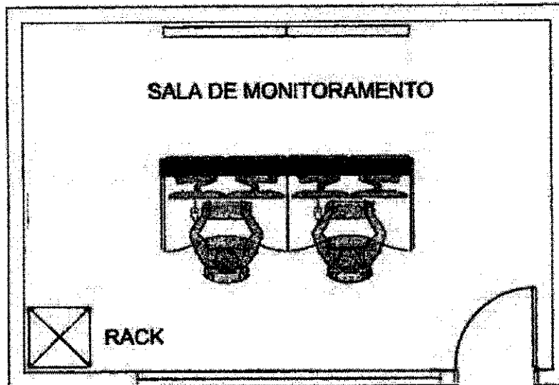
Figura 01– Layout Sala de Operação e Monitoramento

6.5.3. A sala deverá ser equipada com o conjunto de videowall adquirido pela CONTRATANTE, conforme o tamanho e a necessidade da Administração, tendo como parâmetro o layout abaixo, a título meramente ilustrativo.