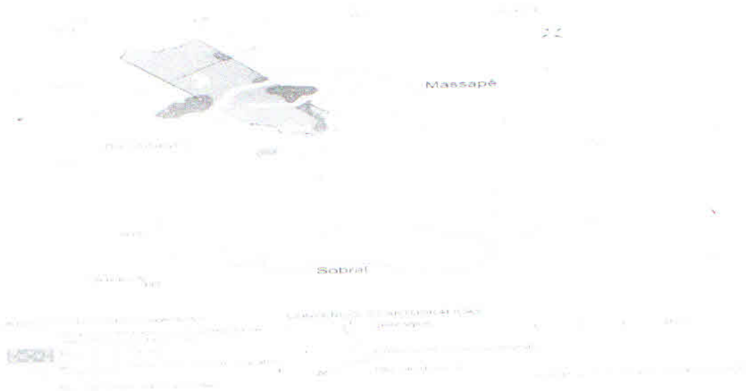
FIGURA 1.2.: MAPA GEOLÓGICO DO MUNICÍPIO DE MERUOCA.

MERUOCA ESTÁ INSERIDA NO DOMÍNIO DOS ESCUDOS E MACIÇOS RESIDUAIS COMPOSTOS DE LITOTIPOS DATADOS DO PRÉ-CAMBRIANO (SOUZA, 1988, APUD LIMA, 1999). OS MACIÇOS RESIDUAIS COMPREENDEM AS SERRAS CRISTALINAS, QUE APRESENTAM EXTENSÕES VARIADAS E ALTITUDES QUE OSCILAM ENTRE 400 A 600 METROS ATÉ 700 A 800 METROS E, RARAMENTE, ULTRAPASSAM AS COTAS DE 900 A 1.000 METROS, (VIDAL ET AL 2005). A FIGURA 1.2. APRESENTA O MAPA GEOLÓGICO DO MUNICÍPIO DE MERUOCA DE ACORDO COM ESTUDOS DE VASCONCELOS ET AL (2007).