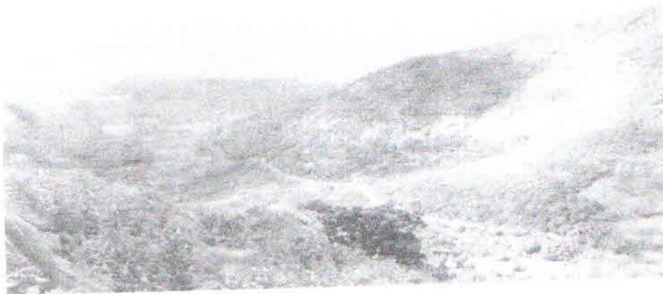
FIGURA 1.2.1: VISTA PARCIAL DA SERRA DE MERUOCA

O SOLO QUE MAIS SE EXPRESSOU NO CENÁRIO DA PAISAGEM FOI O ARGISSOLO. OS ARGISSOLOS APRESENTAM PERFIS BEM DIFERENCIADOS, COMUMENTE PROFUNDOS, POUCAS VEZES RASOS (COSTA FALCÃO E FALCÃO SOBRINHO, 2002).