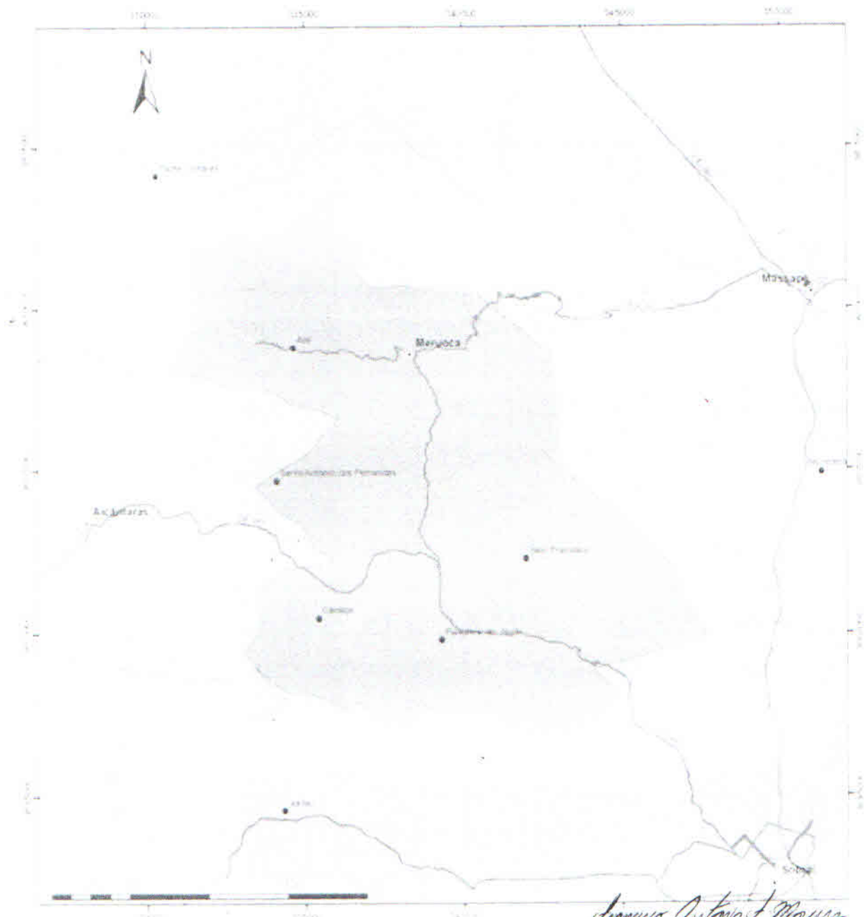
1.1.2. MAPA DO MUNICÍPIO DE MERUOCA