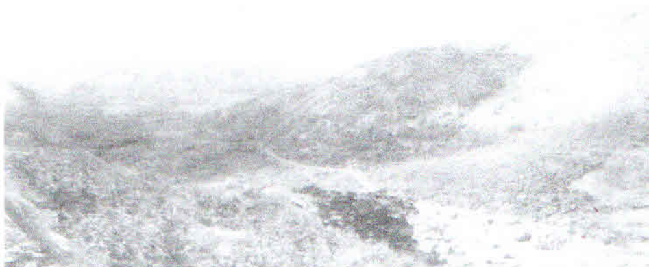
FIGURA 1.2.1: VISTA PARCIAL DA SERRA DE MERUOCA

O SOLO QUE MAIS SE EXPRESSOU NO CENÁRIO DA PAISAGEM FOI O ARGISSOLO. OS ARGISSOLOS APRESENTAM PERFIS BEM DIFERENCIADOS, COMUJENTE PROFUNDOS, POR VezES RASOS (COSTA FALCÃO E FALCÃO SOBRINHO, 2002).