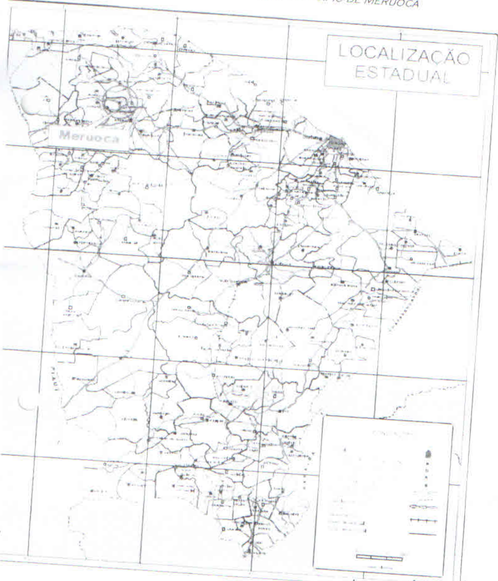
1.1. MAPA DO ESTADO DO CEARÁ COM DESTAQUE MUNICÍPIO DE MERUOCA